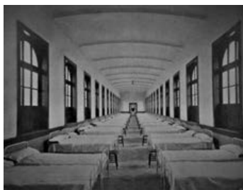
Imagen 8. Dormitorio.