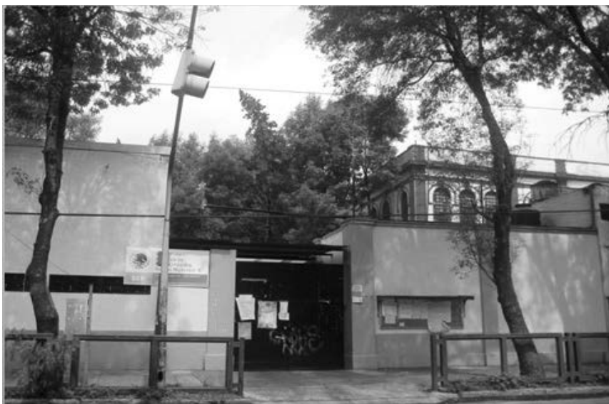
Imagen 1. Fachada moderna de la Escuela de Participación Social número 6, nótese atrás, parte del edificio original del Hospicio para Niños construido en 1905 que pervive actualmente.

En la colonia Asturias de la Alcaldía Cuauhtémoc, en un predio cercano al viaducto Miguel Alemán y la calzada San Antonio Abad, entrando por la calle José Antonio Torres, tras un portón sin gracia alguna, en un predio de amplios patios, jardines arbolados y una edificación antigua de dos plantas, de sólidos y elegantes muros. Es la Escuela de Participa-