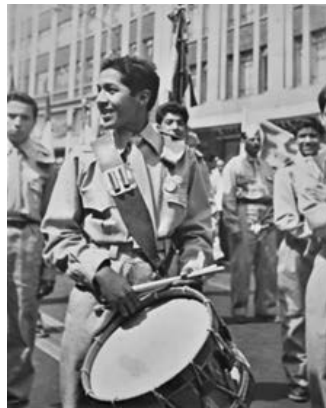
Imagen 11. Banda de guerra del INI. Desfile del 1 de mayo de 1960.

De su día a día, las actividades de los internos en el INI eran las siguientes: