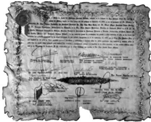
Imagen 14. Acta de demolición del Internado Nacional Infantil, 1 de diciembre de 1963.

nustiano Carranza. Para entonces, eran dependientes del Sistema Nacional para el Desarrollo Integral de la Familia (DIF), hasta 1993 y quedaron bajo la supervisión de la Secretaría de Educación Pública, con el nombre con Escuelas Asistenciales y actualmente Escuelas de Participación Social. 25