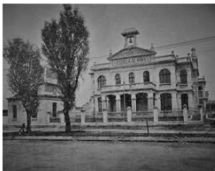
Imagen 9. Escuela de niñas.