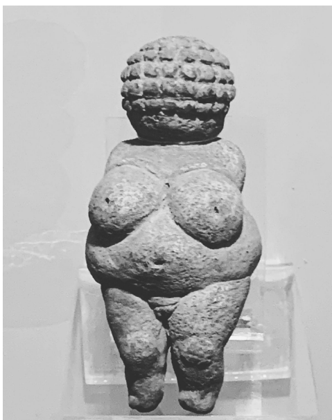
Imagen 1. Diosa Madre en el Museo de Historia Natural.

La naturaleza del mito ha sido discutida desde tiempos muy remotos, a partir de las ciencias sociales y humanidades, aunque ha sido centro de polémica. Acontecimientos sometidos a un orden sintagmático, siempre como un relato ficticio —claramente diferenciable de prácticas y rituales, aunque como lo ha hecho notar Edmund Leach, inseparable de éstas—, el mito es la expresión oral y las prácticas rituales representan hechos concretos. 17 El mito sería entonces una forma de expresión lingüística, pero con propiedades especiales solamente asimilables si se les interpreta por encima del discurso habitual. Para su comprensión es necesario abstraer, pues, sus unidades constitutivas o mitemas , recogidas por medio de las diferentes versiones del mito: “postulamos, en efecto que las verdaderas unidades constitutivas del mito no son unidades aisladas, sino haces de relaciones y que sólo en forma de combinaciones de estos haces, las unidades constitutivas adquieren una función signifiicante”. 18