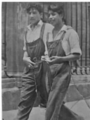
Imagen 10. Alumnos del INI con su uniforme de diario.