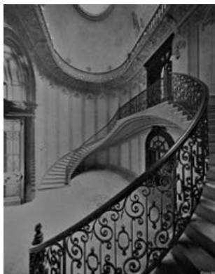
Imagen 7. Vestíbulo.