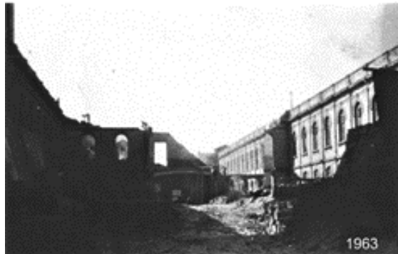
Imagen 15. 1963 Demolición de la mayor parte del edificio del Hospicio.

De las edificaciones originales no derribaron una pequeña fracción; en ella actualmente funciona la Escuela de Participación Social Número 6, que atiende 222 alumnos, 26 donde reciben, además del servicio educativo (primaria y talleres), atención asistencial que incluye dos comidas al día y uniformes una vez al año. 27