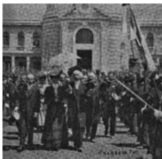
Imagen 3. Invitados a la inauguración del Hospicio Carmen Romero del brazo de Ramón Corral.

La inauguración se celebró el 17 de septiembre de 1905. Ante el hermoso edificio de estilo francés, el presidente Díaz pudo decir que “sus condiciones de confort e higiene eran las que correspondían a un asilo moderno”. 8 A continuación, se describe el inmueble en una amplia y detallada crónica publicada por el periódico El Imparcial dos días antes del evento. 9