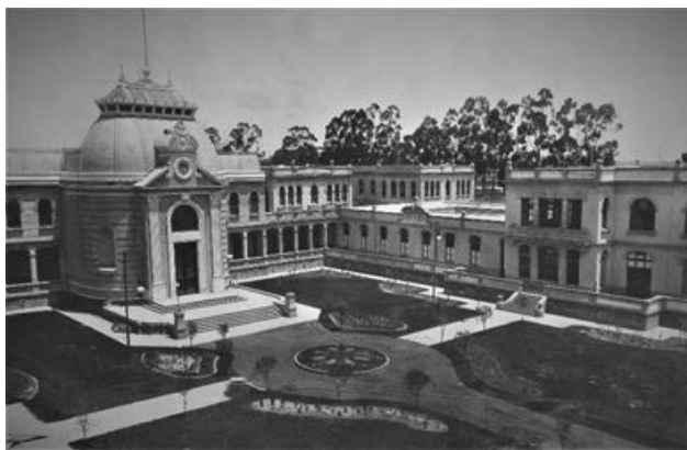
Imagen 6. Fachada y patio principal.