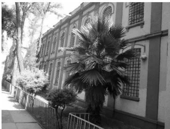
Imágenes 16 y 17. Del conjunto arquitectónico original solamente sobrevive una mínima parte.