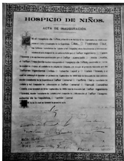
Imagen 5. Acta de Inauguración del Hospicio de Niños. 11

años pasaban a la Escuela Industrial donde completaban su instrucción primaria y aprendían algún oficio mecánico. Las niñas, al llegar a los quince años, si tenían familias, eran entregadas a ellas, y, en caso contrario, continuaban en el hospicio hasta los 24 años, o antes, si podían bastarse a sí mismas, haciendo uso de los medios que les proporcionaba la educación adquirida en el plantel. Para este efecto, el hospicio contaba con talleres de cocina y de corte y confección. 10