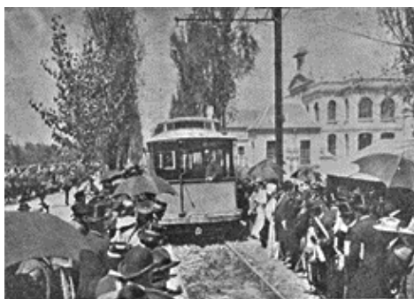
Imagen 4. La comitiva tomando los trenes al regreso después de la inauguración.

Con el Hospicio de Niños, Díaz y su equipo de “Científicos” pretendían instituir un complejo sistema de atención a niños desamparados, que iniciaba en la Casa de Párvulos dedicada a la crianza y educación de niños abandonados, desde recién nacidos hasta los cinco años; de esta edad a los doce años eran admitidos en el hospicio, y las niñas, de los seis a los catorce. Cuando los asilados varones cumplían los doce