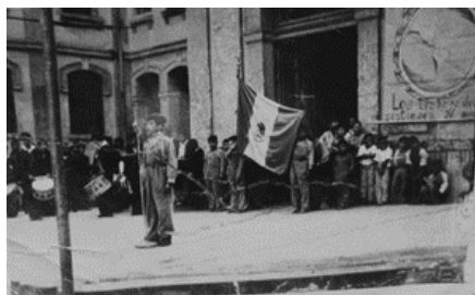
Imagen 13. Honores a la bandera.

Sobre los estudios y actividades escolares en el INI, Otilio dijo: