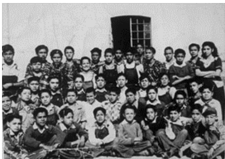
Imagen 12. Alumnos del INI.

Para entrar al comedor, lo hacíamos formándonos en la puerta y conforme íbamos entrando, dos internos nos iban dando a cada uno, tres tortillas, un pan y una fruta. Para la comida nos daban sopa aguada, arroz, un guisado. La comida se servía en las mesas, lo hacían dos internos designados y si quedaba en la olla, la repartían entre sus “cuates”.