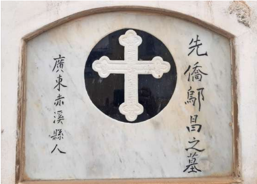
Pasadizo N° 03, lado E Tipo: Nicho Número: 143 Característica: Individual Detalle: Inscripciones chinas. Archivo: JCAT