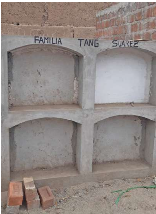
Pasadizo N° 01, lado A Tipo: Tumba Número: 14 Característica: Multifamiliar Detalle: Familia Tang Suárez. Archivo: JCAT