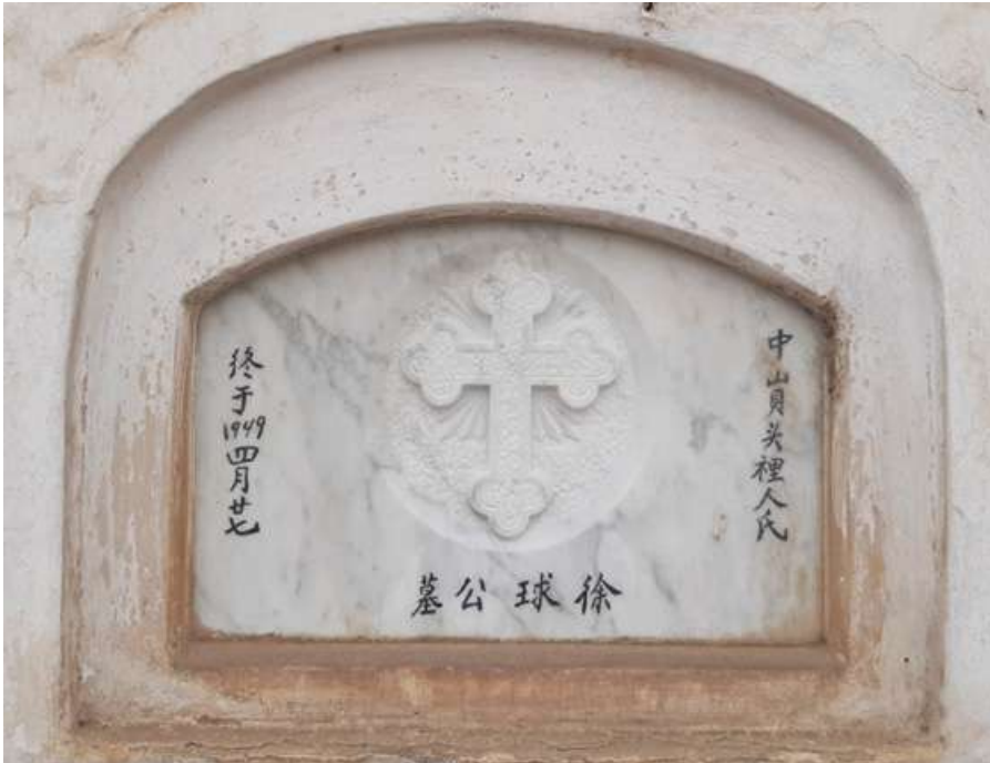
Pasadizo N° 03, lado E Tipo: Nicho Número: 157 Característica: Individual Detalle: Inscripciones chinas. Archivo: JCAT