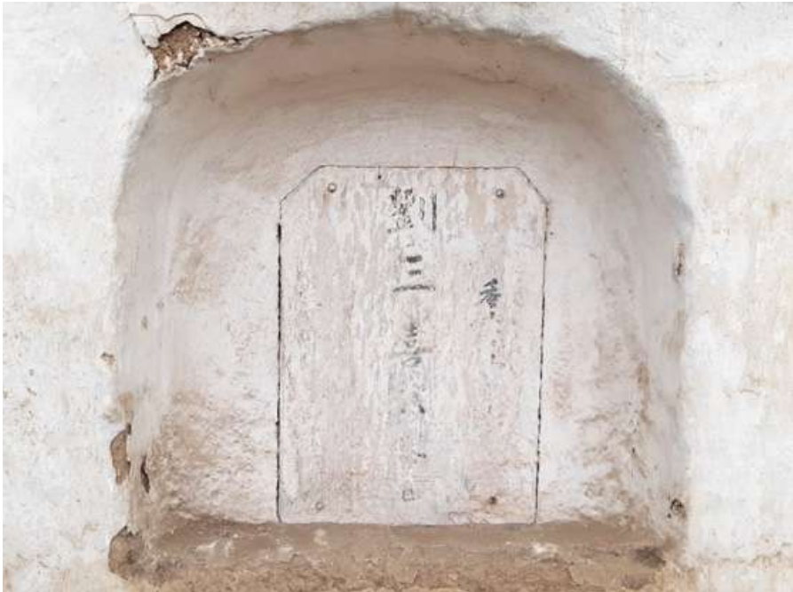
Pasadizo N° 03, lado E Tipo: Nicho Número: 158 Característica: Individual Detalle: Inscripciones chinas. Archivo: JCAT