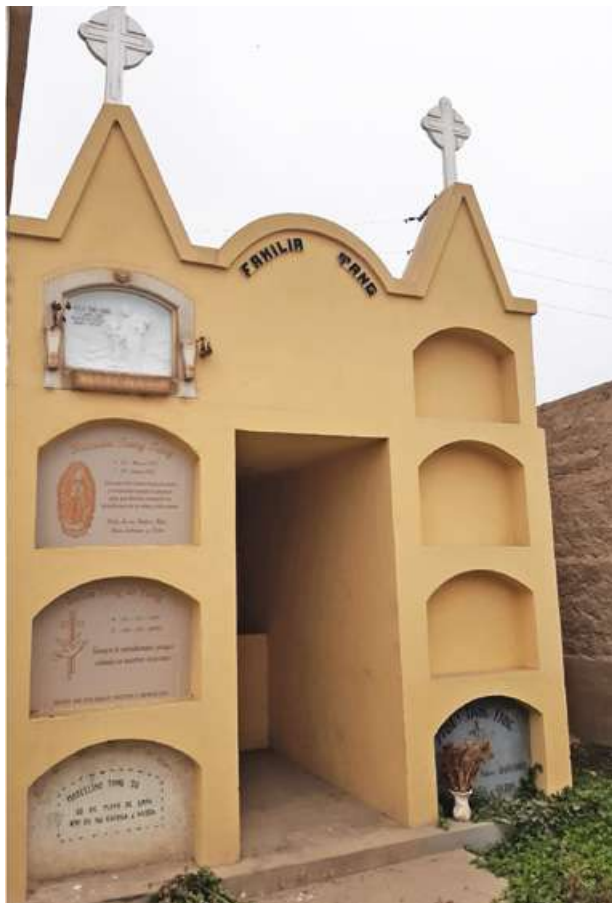
Pasadizo N° 02, lado C Tipo: Mausoleo Número: 93 Característica: Familiar Detalle: Familia Tang. Archivo: JCAT