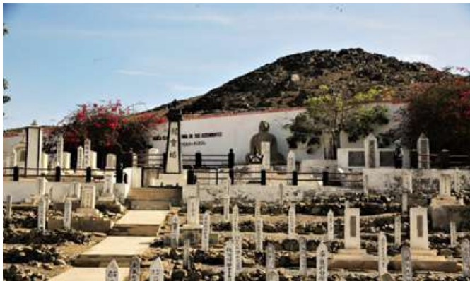
Cementerio japonés Sukeo Isayama (Barranca). Fotografía de Varillas Justo Emerson Ronaldo, 2024.

En el Norte Chico existen también cementerios japoneses, como Sukeo Isayama (Barranca) y Jin Bochi (Huaral), donde sólo pueden ser enterrados difuntos de esa nacionalidad. Cabe precisar que la historia de todos estos cementerios, especialmente de los chinos y japoneses, es todavía una tarea pendiente para los investigadores de ciencias sociales, quienes, además de rescatar su origen, deberían abordar sus costumbres y ritos funerarios, analizar la iconografía relacionada con la muerte, estudiar e interpretar los epitafios, y estudiar la arquitectura funeraria desde una perspectiva multidisciplinaria.