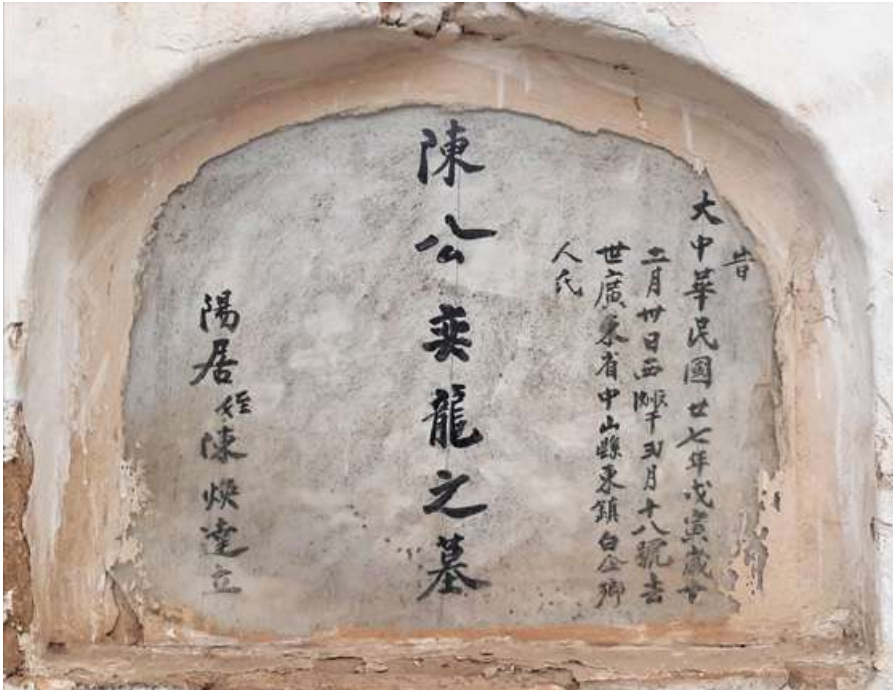
Pasadizo N° 03, lado E Tipo: Nicho Número: 139 Característica: Individual Detalle: Inscripciones chinas.