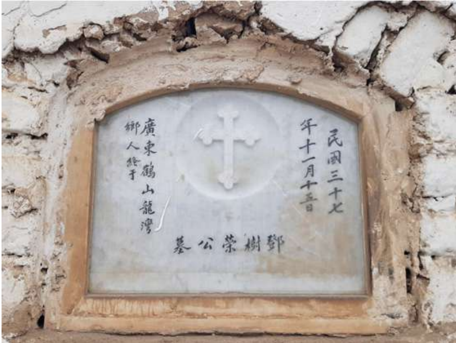
Pasadizo N° 03, lado E Tipo: Nicho Número: 153 Característica: Individual Detalle: Inscripciones chinas. Archivo: JCAT