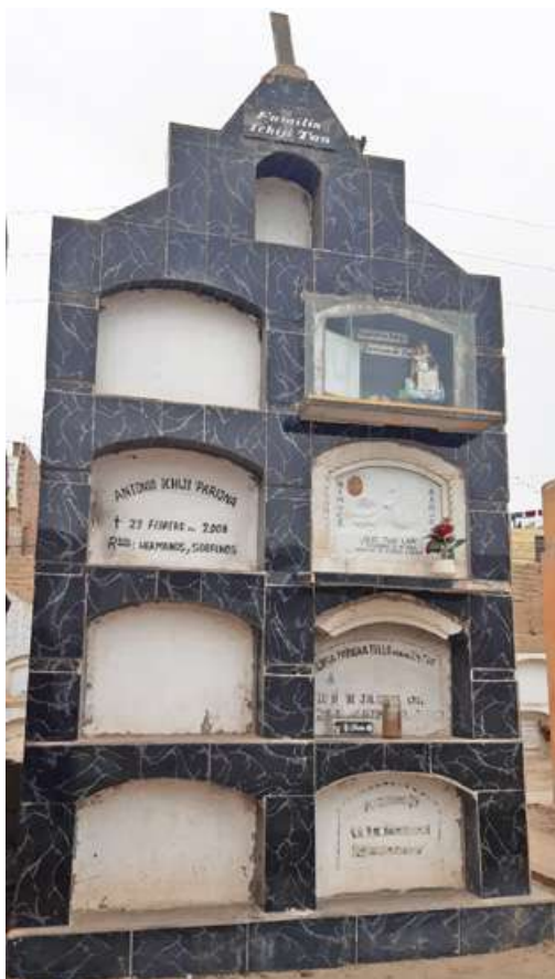
Pasadizo N° 02, lado C Tipo: Nicho Número: 104 Característica: Individual Detalle: Familia Ichiji Tan. Archivo: JCAT