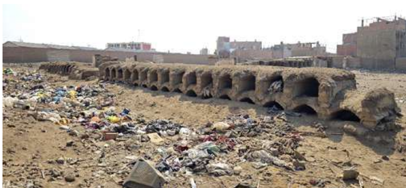
Cementerio chino (Hualmay). Fotografía de César Augusto Romero Quispe, 2024.

En Hualmay también existe un cementerio chino casi desaparecido que algunos consideran que se remonta a final del siglo XIX. Sobre este lugar muchas historias y leyendas urbanas son muy conocidas por los vecinos, y más de uno siempre están deseosos de contar.