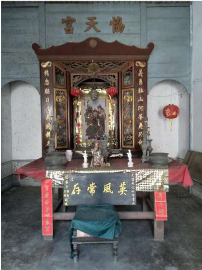
Santuario chino (Pativilca). Fotografía de Emerson Ronaldo Varillas Justo, 2024.

Por otro lado, los trabajadores chinos comenzaron a experimentar la introducción de máquinas en las haciendas, las fuertes enfermedades respiratorias en las islas guaneras, así como la religiosidad budista al interior de los galpones o en las inmediaciones de las haciendas con autorización del mismo propietario. De estos altares o santuarios, que podían ser fijos o plegables, llama la atención la presencia de abundantes imágenes de budas y otras figuras “grotescas” que asemejaban a diablos y dragones. Es preciso anotar que, a diferencia de los africanos, los hacendados nunca procuraron la evangelización o conversión de los chinos.