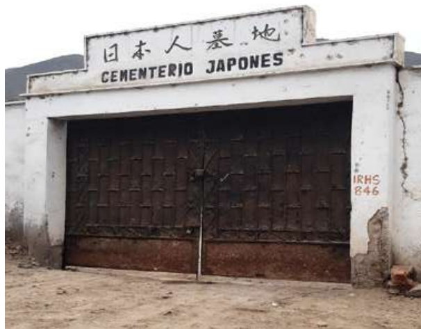
Cementerio japonés Jin Bochi (Huaral).