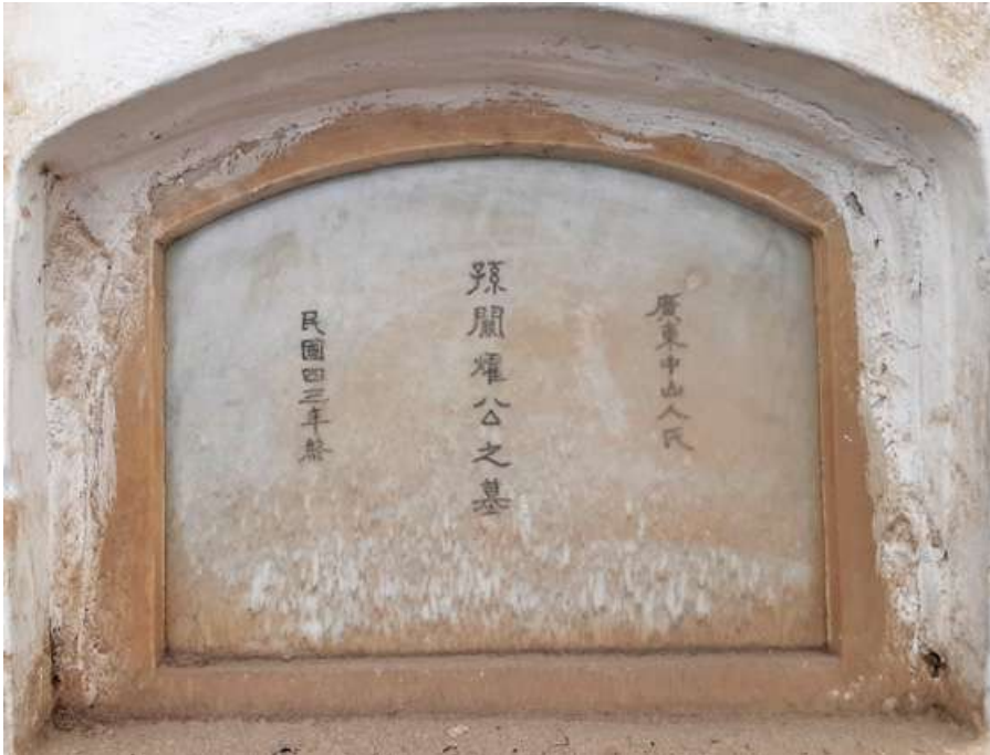
Pasadizo N° 03, lado F Tipo: Nicho Número: 168 Característica: Individual Detalle: Inscripciones chinas. Archivo: JCAT