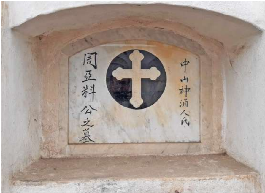
Pasadizo N° 01, lado B Tipo: Nicho Número: 74 Característica: Individual Detalle: Inscripciones chinas. Archivo: JCAT