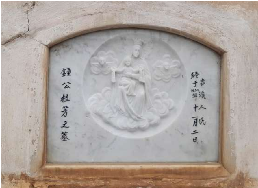
Pasadizo N° 01, lado B Tipo: Nicho Número: 61 Característica: Individual Detalle: Inscripciones chinas.