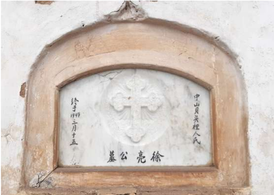
Pasadizo N° 03, lado E Tipo: Nicho Número: 149 Característica: Individual Detalle: Inscripciones chinas. Archivo: JCAT