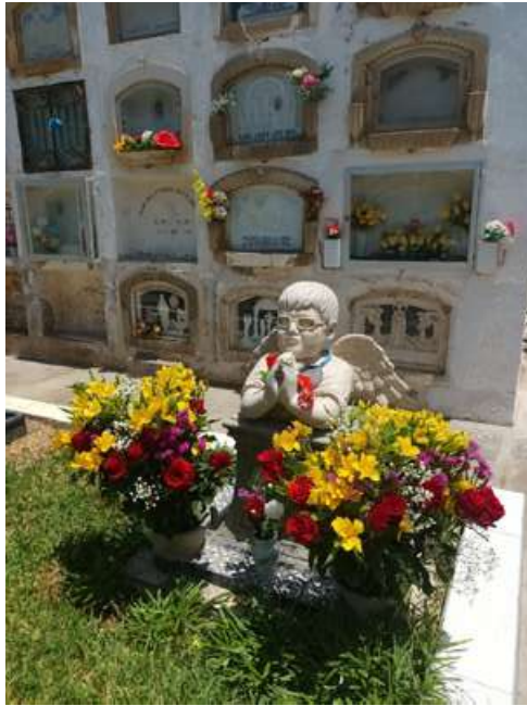
Cementerio General San Bartolomé (Huacho). Fotografía de Ángela Rojas Muñoz, 2024.