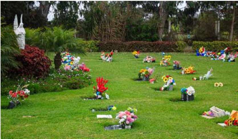
Camposanto Parque de los Ángeles (Santa María). Fotografía de Maricelo Fernanda Fernández Pozo, 2024.