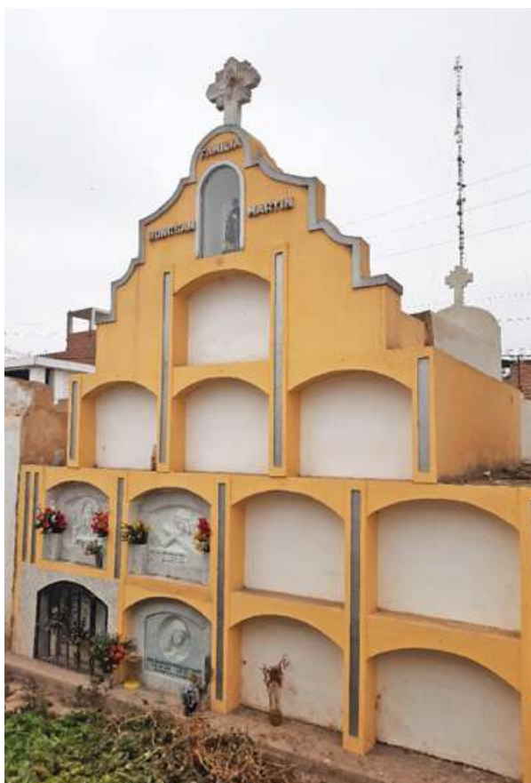
Pasadizo N° 01, lado B Tipo: Mausoleo Número: 86 Característica: Familiar Detalle: Familia Martín Tong San.