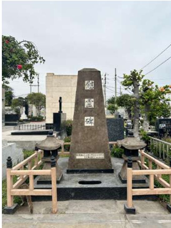
Cementerio General San Bartolomé (Huacho).

Pero en el Norte Chico podemos ubicar cementerios privados como los de Santa María denominados Camposanto Parque de los Ángeles y Camposanto Jardín Eterno, así como en Huaura el camposanto Virgen del Carmen. Junto a ellos existen cementerios privados de origen chino, siendo el más conocido el de Huaral, que algunos denominan Cementerio Chino La Huaquilla.