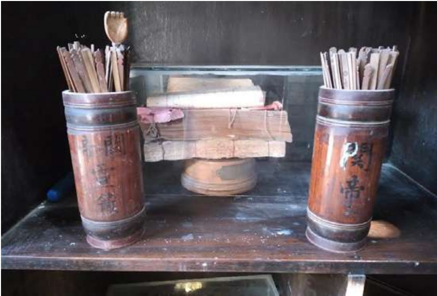
Ajuar de santuario chino (Pativilca). Fotografía de Emerson Ronaldo Varillas Justo, 2024.