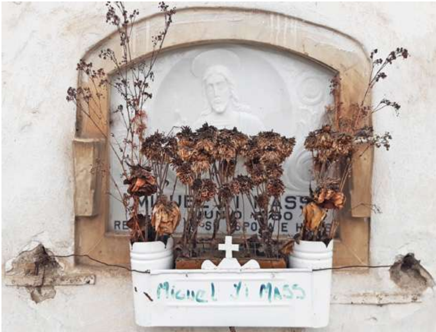
Pasadizo N° 03, lado E Tipo: Nicho Número: 159 Característica: Individual Detalle: Miguel Yi Mass, ? Archivo: JCAT