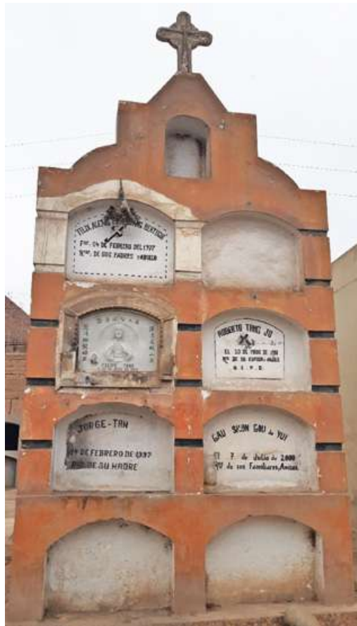
Pasadizo N° 02, lado C Tipo: Mausoleo Número: 110 Característica: Múltiple Detalle: Familia Tang. Archivo: JCAT