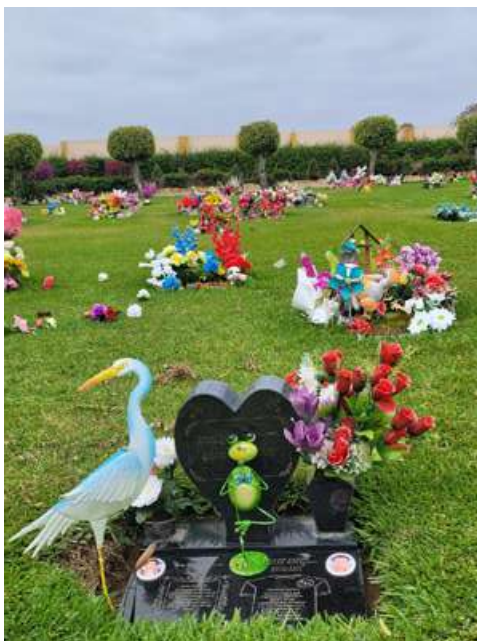
Camposanto Parque de los Ángeles (Santa María). Fotografía de Carol Calderón Cervantes, 2024.

En Hualmay también existe un cementerio chino casi desaparecido que algunos consideran que se remonta a final del siglo XIX. Sobre este lugar muchas historias y leyendas urbanas son muy conocidas por los vecinos, y más de uno siempre están deseosos de contar.