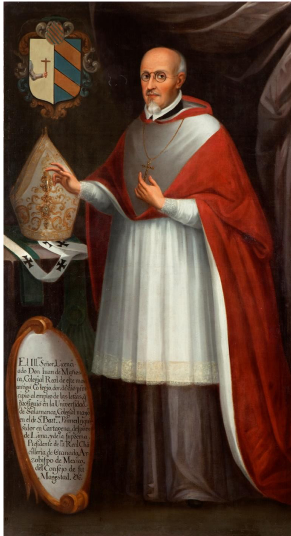
Anónimo, siglo XVII. Retrato de cuerpo completo de Juan de Mañosca y Zamora , 1,2 óleo sobre lienzo. Pinacoteca del Antiguo Palacio de Medicina (antes Palacio de la Inquisición).