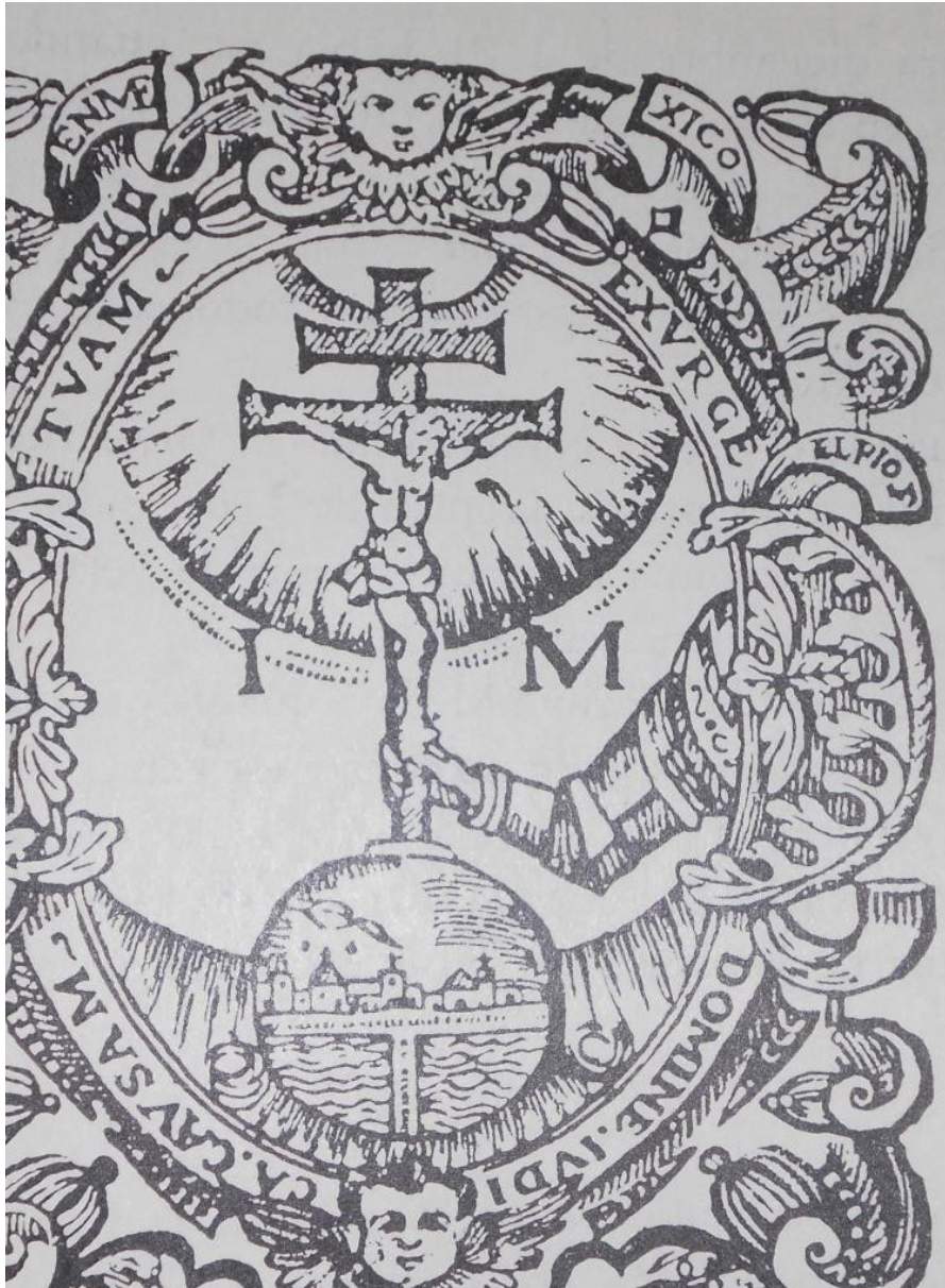
Escudo de la Inquisición utilizado en el libelo conmemorativo para el Auto General de Fe de 1649, imagen del libro de Francisco de la Maza, El Palacio de la Inquisición.