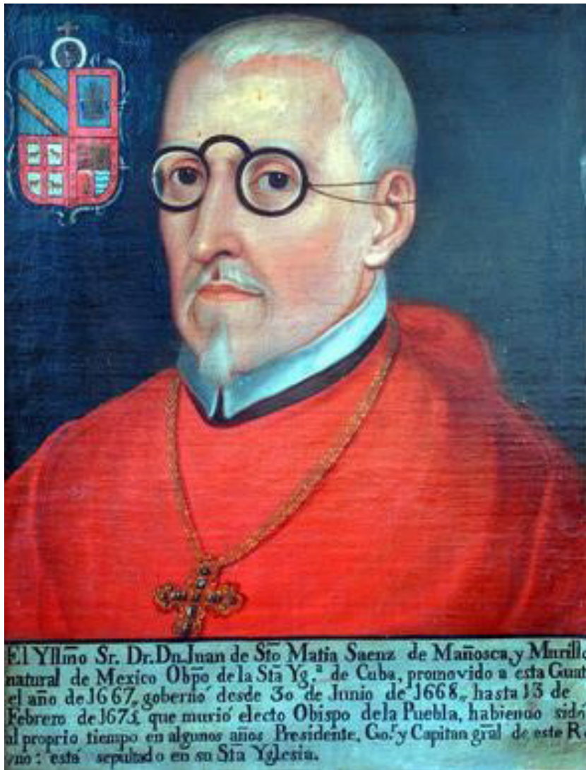
Anónimo, siglo XVII. Retrato de Juan Sáenz de Mañozca , óleo sobre lienzo. Catedral de Guatemala.