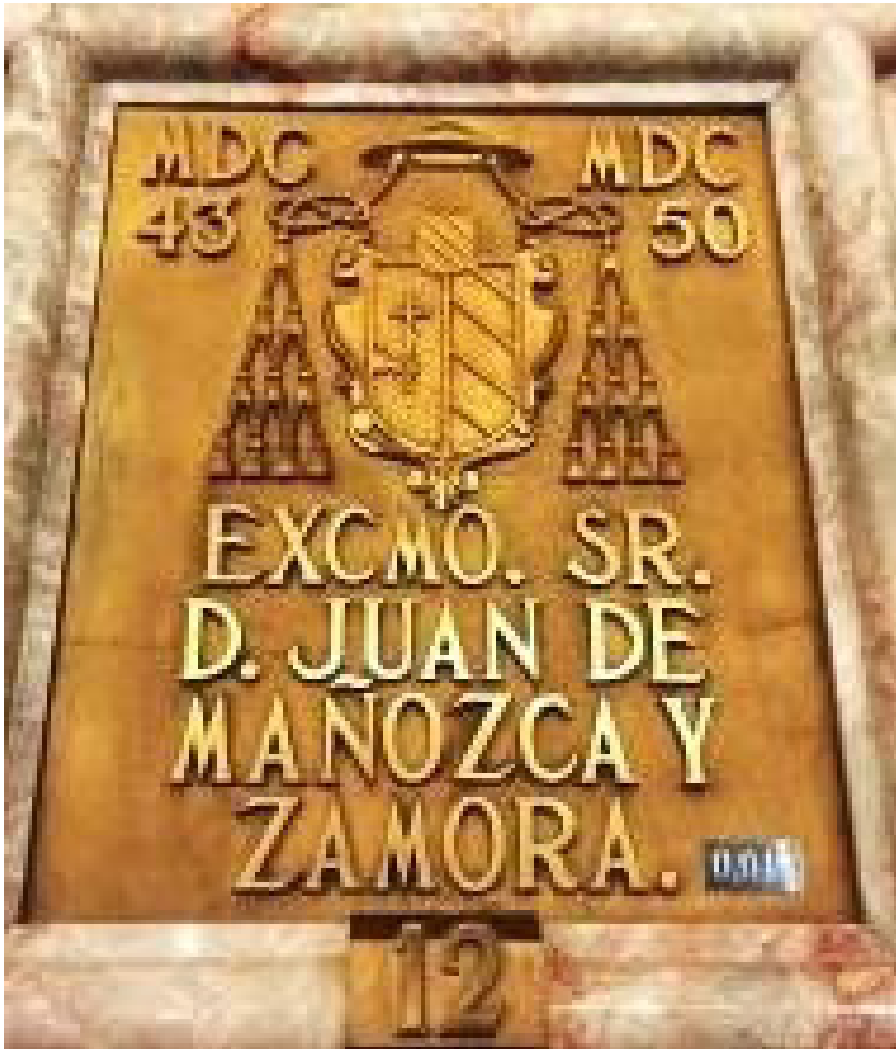
Tumba de Juan de Mañozca y Zamora, ubicada en las criptas arzobispaes de la Catedral Metropolitana.