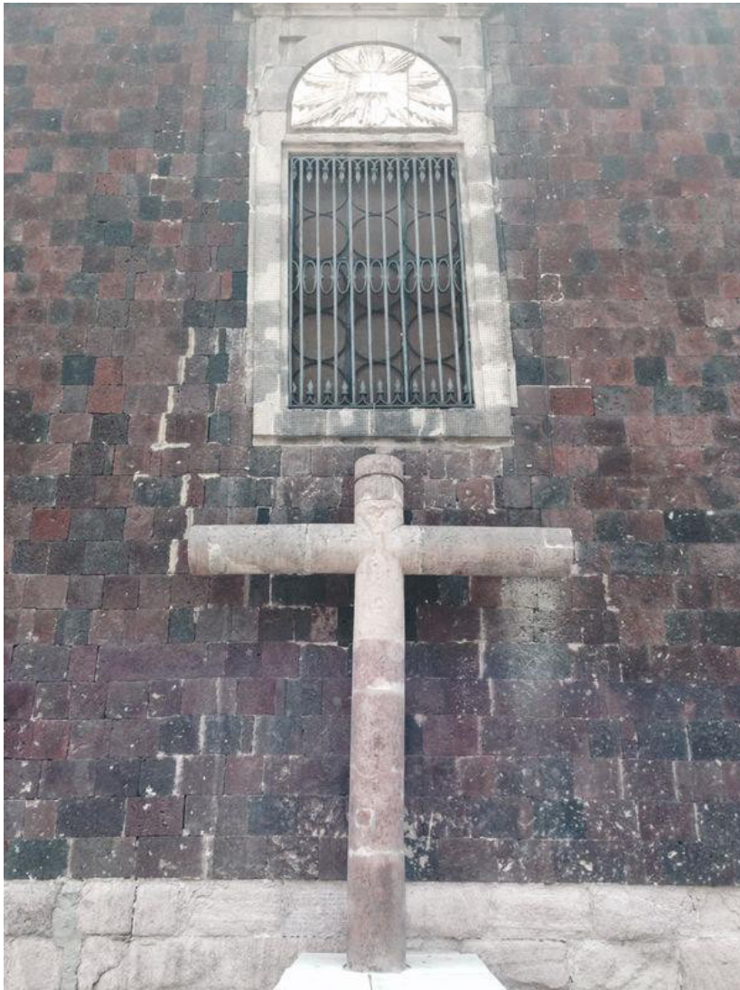
La Cruz de Mañozca en la actualidad, fotografía de Víctor Cruz Lazcano.