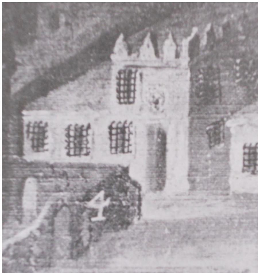
Palacio de la Inquisición del siglo XVII, imagen tomada del libro de Francisco de la Maza, El Palacio de la Inquisición .