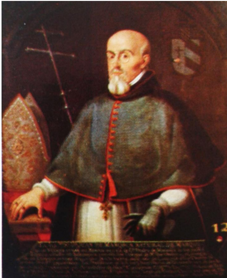
Anónimo, siglo XVIII. Retrato de medio cuerpo de Juan de Mañozca y Zamora , 3,4 óleo sobre lienzo, 164.5 X 128.5372. Sala Capitular de Catedral, imagen tomada del libro Catedral de México Patrimonio artístico y cultural .