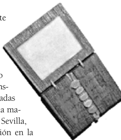
Tablilla de escritura romana.

Las aulas desaparecieron de la mayor parte del Imperio Romano durante la época de las invasiones bárbaras (siglo V al siglo VIII), debido a que fueron abandonadas y por la disminución de la asistencia de los menores a la escuela. Sin embargo, el grupo privilegiado siguió asistiendo a clases con instrucción católica, es decir, escuelas privadas dirigidas por maestros religiosos. Quizá la mayor prueba de esto fue el sabio Isidoro de Sevilla, quien escribió un libro sobre la educación en la España del siglo VII. Gracias a ese texto, llamado Las etimologías podemos saber que al iniciar la Edad Media en el aula católica, además de los tres saberes básicos latinos (leer, escribir y contar), se enseñó a cantar y a ejecutar música. 4 De esta forma, se sentaron las bases del quadri-